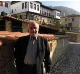
Αρχοντικό Βέργου Ο συγγραφέας στην παλιά πόλη Vergos Mansion The writer at the old city

Ο Λεωνίδας Παπάζογλου γεννήθηκε στην Καστοριά το 1872. Απεβίωσε το 1918 σε ηλικία 46 ετών, θύμα της ισπανικής γρίπης που κόστισε τη ζωή σε χιλιάδες κατοίκους της Μακεδονίας. Έμαθε την τέχνη της φωτογραφίας μαζί με τον αδελφό του Παντελή στην Κωνσταντινούπολη. Όπως όλα δείχνουν, τα δύο αδέρφια από την αρχή της σταδιοδρομίας τους ήταν συνέταιροι. Από τη μελέτη των εκτυπώσεων που έχουν διασωθεί πιθανολογείται ότι ήταν οι πρώτοι φωτογράφοι που κατέγονταν από την Καστοριά και με την έναρξη της δραστηριότητάς τους, το 1898 ή το 1899, κατείχαν το μονοπώλιο της φωτογραφίας σε ολόκληρη την περιοχή. Τα δυο αδέρφια φύλαγαν τα γυάλινα αρνητικά των φωτογραφιών τους ξεχωριστά, ο καθένας στο σπίτι του. Το αρχείο του Λεωνίδα Παπάζογλου, αποτελούμενο από αρκετές χιλιάδες γυάλινες αρνητικές πλάκες, παρέμεινε μετά τον θάνατό του στοιβαγμένο σε ντουλάπια σε δωμάτιο του μεσαίου ορόφου του σπιτιού του. Το καλοκαίρι του 1993, όσες γυάλινες πλάκες βρέσκονταν σε καλή κατάσταση τοποθετήθηκαν σε χαρτοκιβώτια, ενώ οι υπόλοιπες καταστράφηκαν. Δύο χρόνια αργότερα το τμήμα του αρχείου που διασώθηκε περιήλθε με αγορά στον Γιώργο Γκολομπιά.